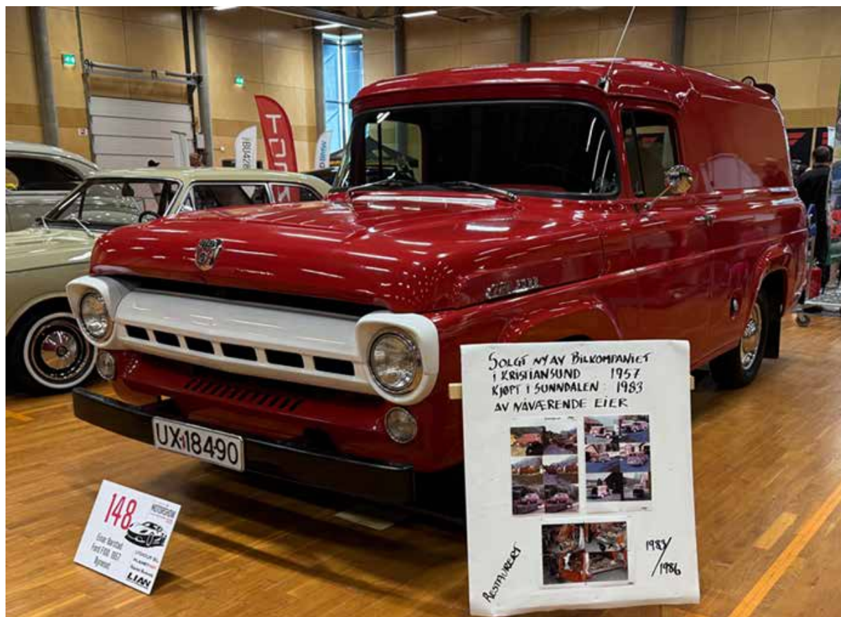
Ford F100 fra 1957 solgt ny i Kristiansund i 1957, har blitt lagt ned mange timer for å få den tilbake i dagens tilstand. Meget pen bil som har rullet mange kilometer på norske veier.