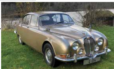
Jaguar S-Type. Modell 1964 Eier: Tor Ove Røe