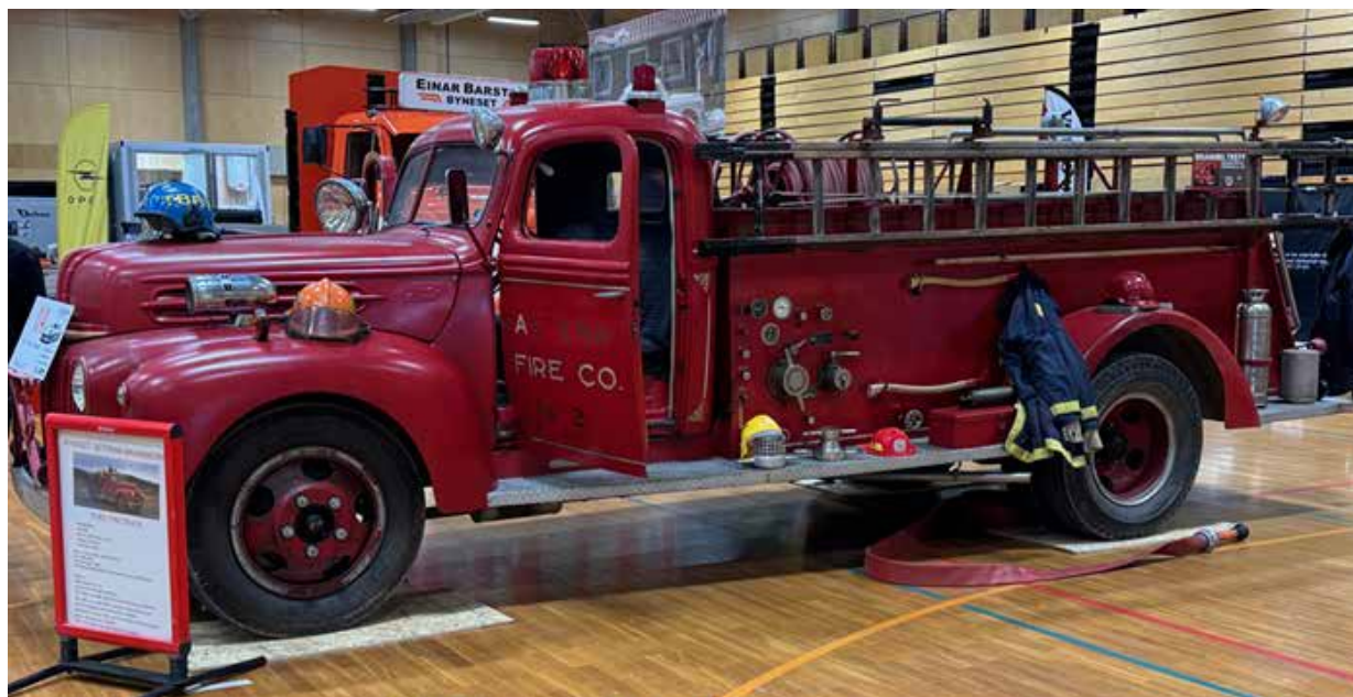
Byneset Veteran-Brannkorps stilte med sin egen Ford 2600 fra 1946. Utstyr og alt på plass for å vise tidsriktig utrustning og klar for oppdrag. Under panseret en Sideventilert V8 på 4 liter. Denne fikk mye oppmerksomhet