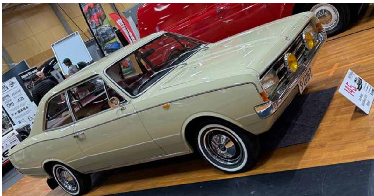
Her er et flott eksemplar av Opel Rekord fra 1970. Ikke noe uvanlig syn tilbake i tiden, men i dag er det få av disse på veiene i denne tilstanden. Skulle nesten tro man var inne hos en bilforhandler på 70-tallet.