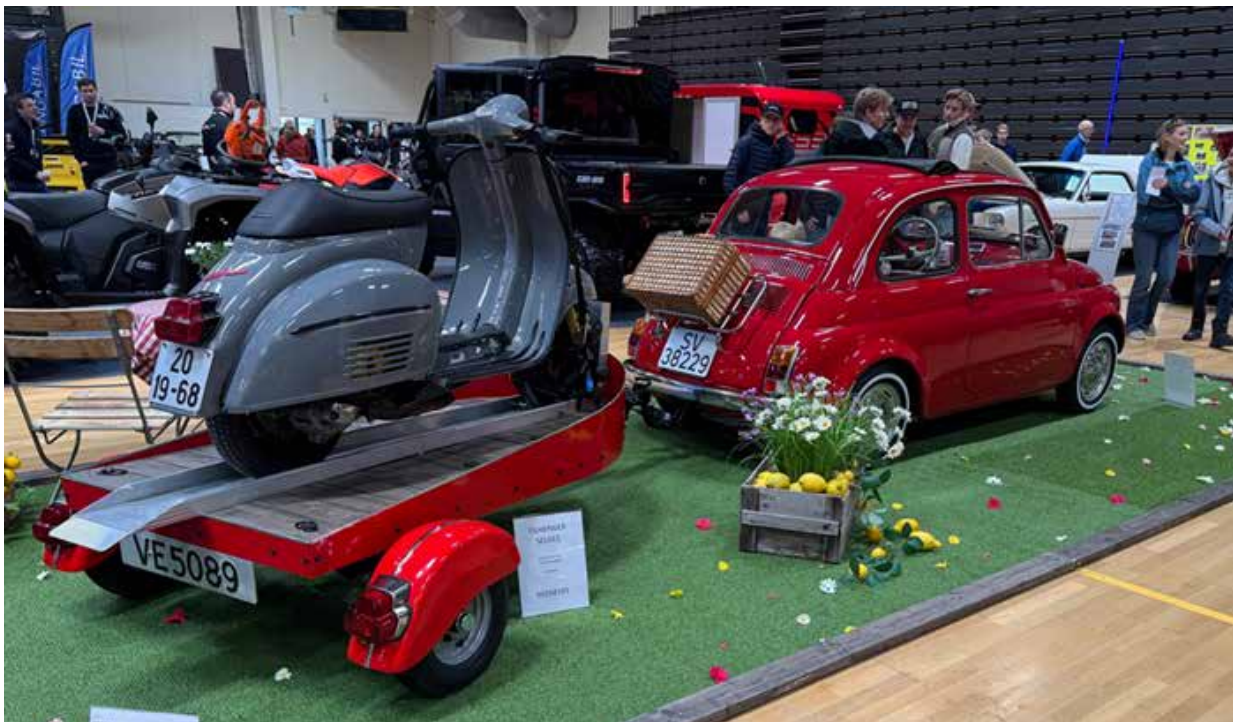
Utrolig pen Fiat 500 fra 1971 med 650cc motor. Bak finner vi en Vespa 125 Super fra 1968 på en tidsriktig og pen tilhenger. Ekte italiensk sjarm uten sidestykke.

Stjørdal Motorshow er mer enn et utstillingsvindu. Det er et treffpunkt. Et pustehull. Og et levende bevis på at motorlidenskapen står sterkt i Midt-Norge – og på tvers av generasjoner.