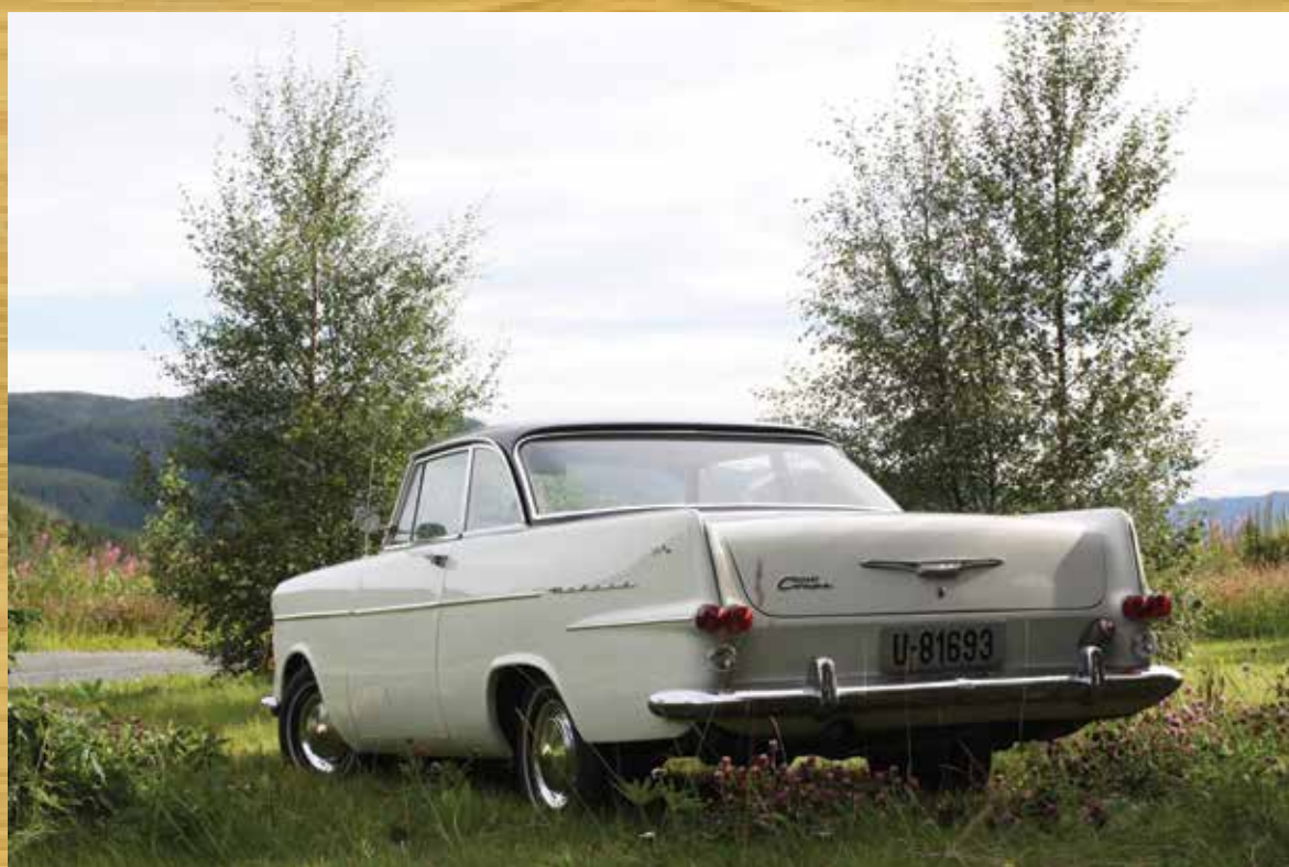
Baksiden av Redaktørens Olympia Rekord P2 Coupe