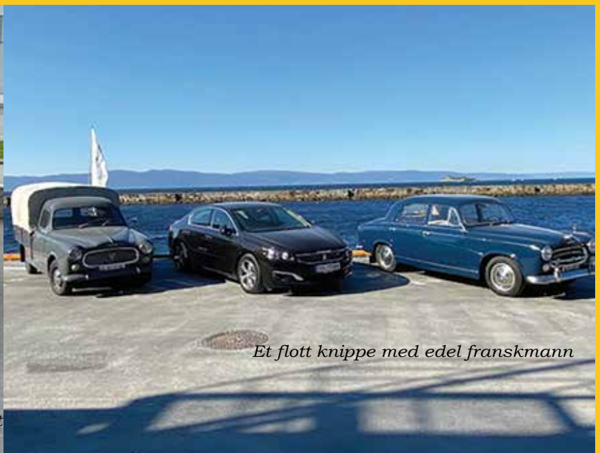
Et flott knippe med edel franskmann